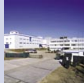
Dalian THK Co., Ltd.