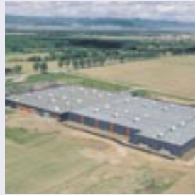
THK Manufacturing of Europe S.A.S.