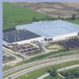
THK Manufacturing of America, Inc.