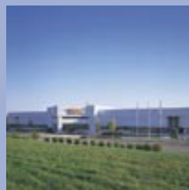
THK America, Inc.