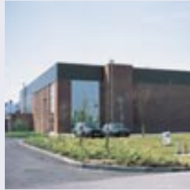
PGM Ballscrews Ireland Ltd.