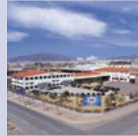
Samick LMS Co., Ltd.