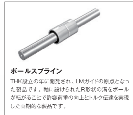
ボールスプライン

1978年にはマシニングセンタの元祖で当時世界トップクラスの米国工作機械メーカーに採用され、それを契機に工作機械へのLMガイドの採用が進んでいきます。