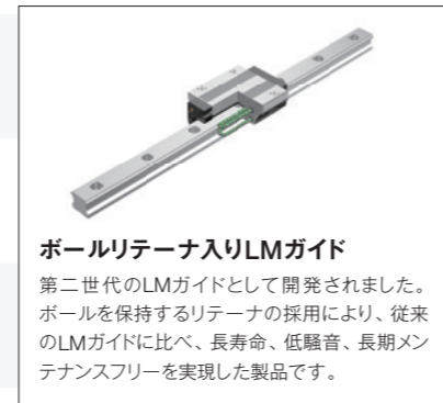
ボールリテーナ入りLMガイド

1990年代は、半導体の需要増加に伴い半導体製造装置向けにLMガイドの採用が急増しました。2000年代には、携帯電話やデジタル家電の普及とともに、半導体製造装置、フラットパネルディスプレイ製造装置などの需要が増加する中で、第二世代のLMガイドであるボールリテーナ入りLMガイドを中心とする製品の採用が増加しました。さらに、モノづくりのグローバル化が進展する中で、THKもグローバルにビジネスを展開していきました。